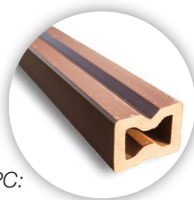
Podkladní hranol WPC: